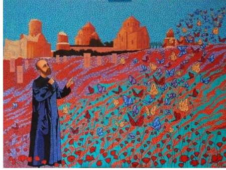
« Le Père Komitas peint par Garo »

Merci encore pour votre accueil à la bibliothèque de Limours.